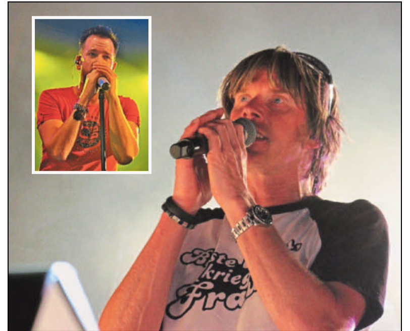
Michael Wendler (kleines Foto) und Mickie Krause sind an diesem Samstag beim Festival »Schlager im Park« dabei. Bereits 2018 feierten 3700 Fans Mickie Krause.