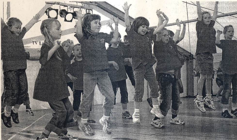
Spritzig: Die ganz kleinen Jazztänzerinnen und -tänzer des TV Löhne Bahnhof waren mit ganz viel Einsatz bei ihrem Auftritt dabei.

36 Vereine und 1.100 Aktive waren eingepplant. Nur ein Bruchteil davon konnte am Wochenende sein Können zeigen. „Das ist schade für die Vereine, aber die Sicherheit geht vor“, sagte Michael Scholz von der Aqua Magica GmbH bedauernd. So mussten am Samstag aufgrund einer Sturmwarnung des Deutschen Wetterdienstes alle Bühnen auf dem Außengelände abgebaut werden. „Auftritte gibt es nur im Zelt.“