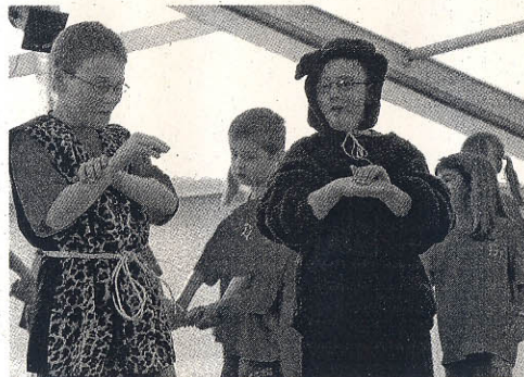
Bärg: Balu der Bär (r.) gab ein Stelldichein beim Auftritt der Jazz- tanz-Mimis des TV Löhne-Bahnhof und brummte sich über die Bühne.